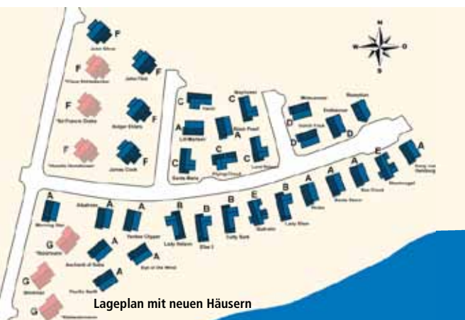
Lageplan mit neuen Häusern