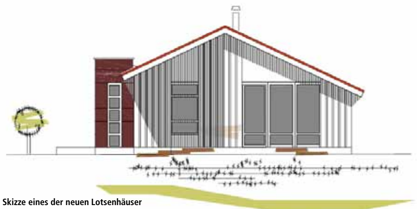
Skizze eines der neuen Lotsenhäuser